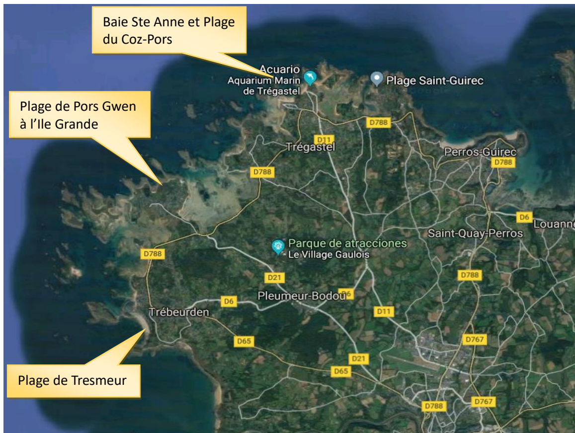
Plage du Coz-Pors à Trégastel

Les lieux d'exposition en intérieur : (optionnel pour l'artiste et à la discrétion de l'organisateur)