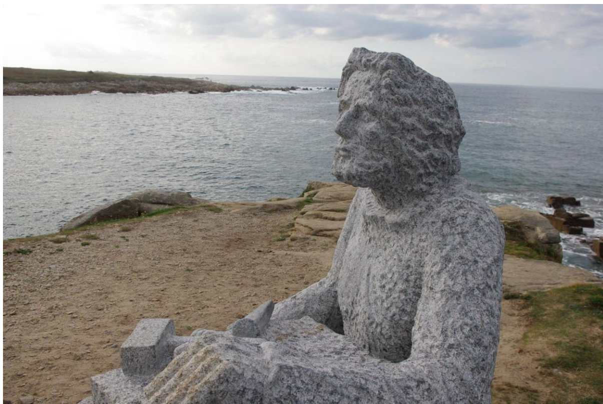
La statue du carrier, de David PUECH