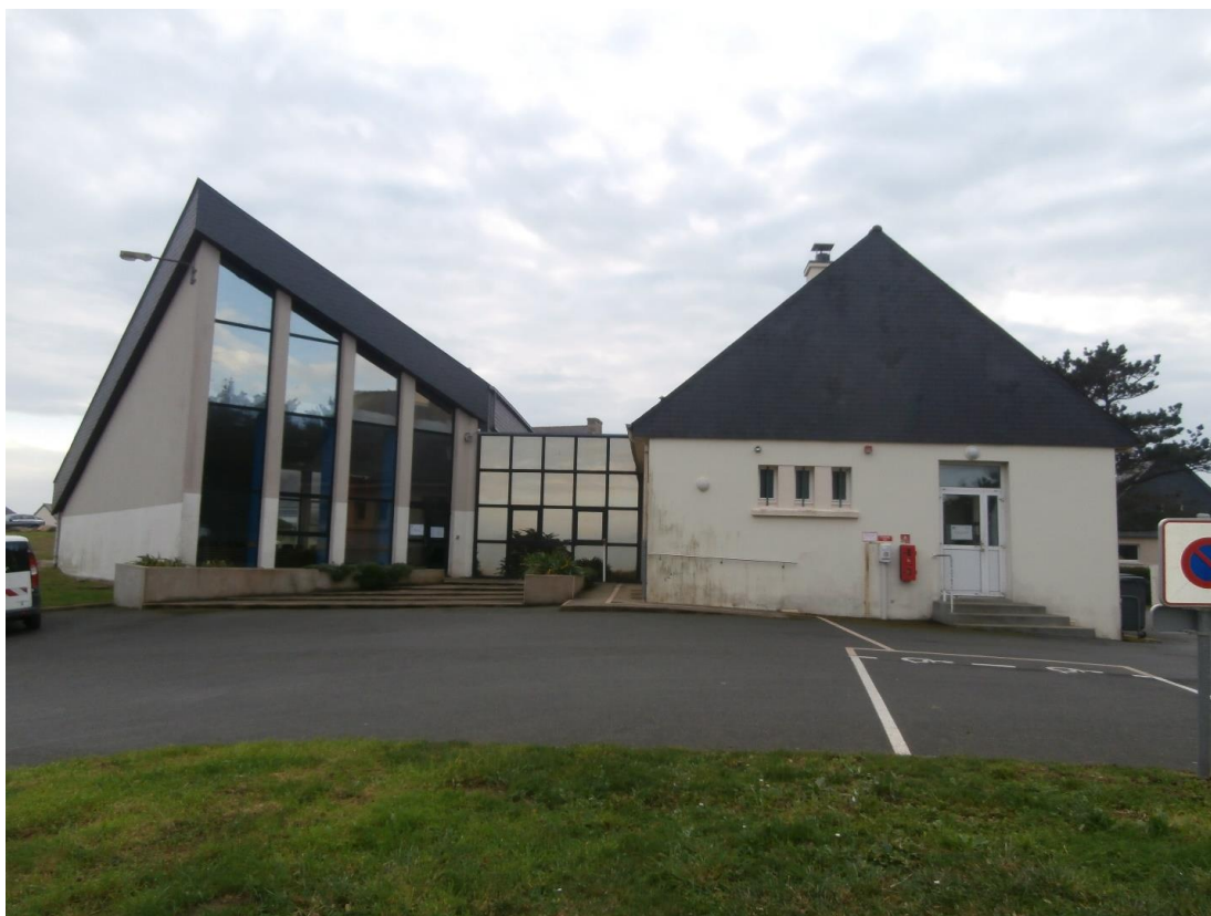
Salle polyvalente de l'Île-Grande : l'extérieur