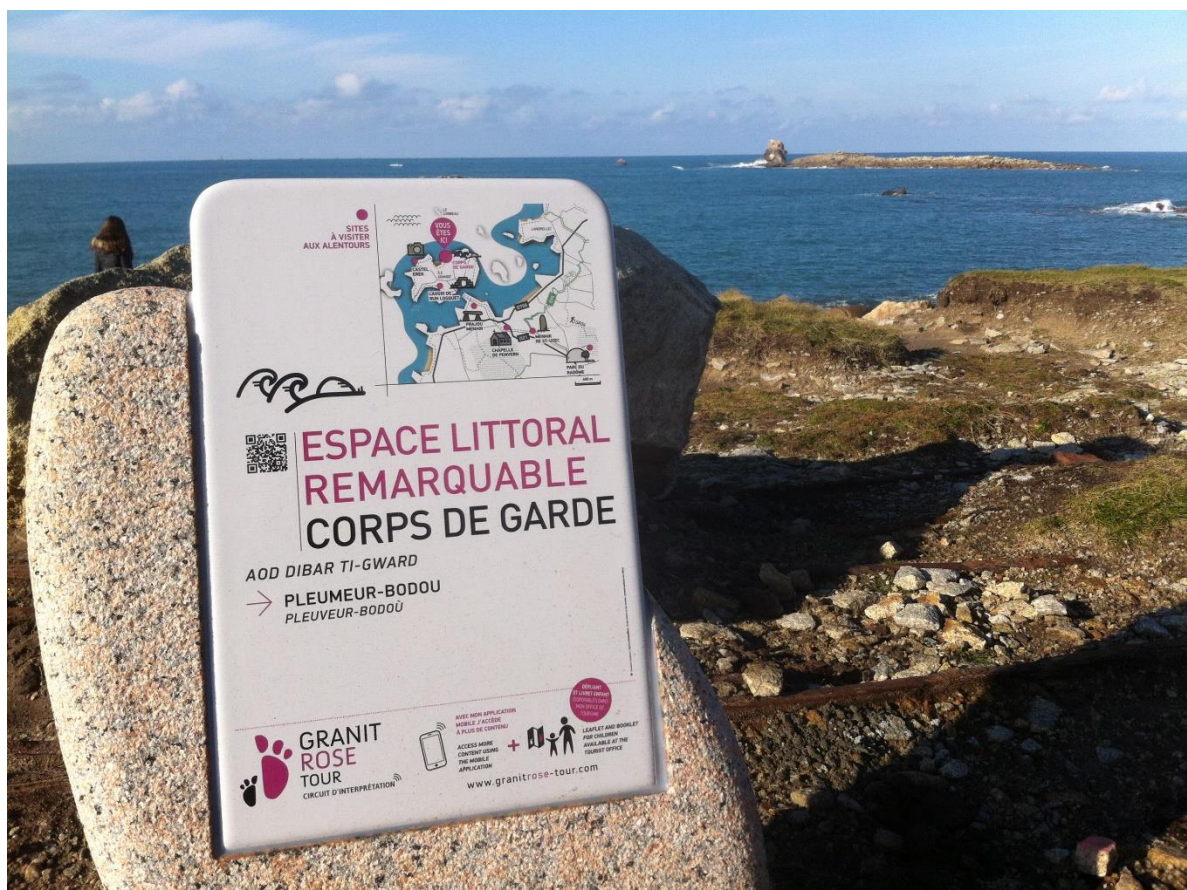
La côte nord de l'île-Grande a été le cadre d'une exploitation industrielle des carrières de granite