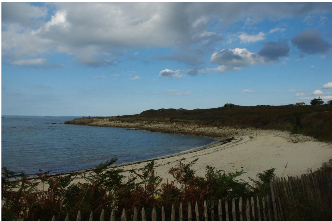
Plage de Porz Gwenn