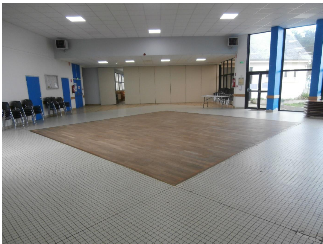
Salle polyvalente de l'Île-Grande : l'intérieur