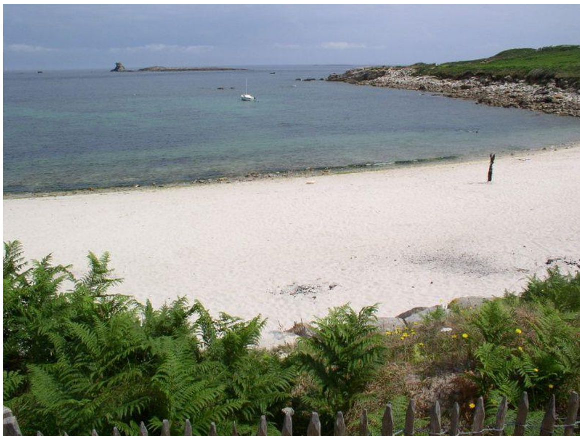
Plage de Pors Gwenn