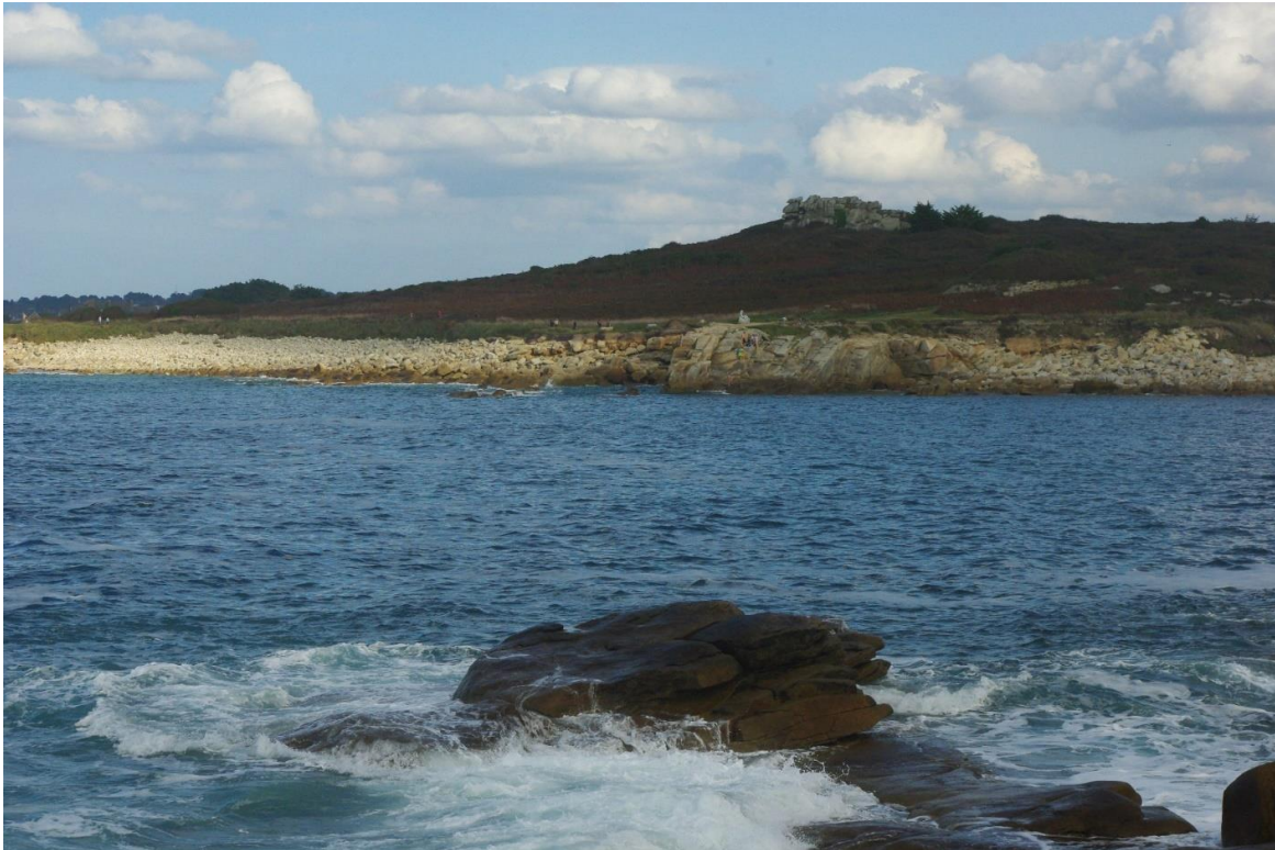
Plage de Porz Gwenn à marée haute