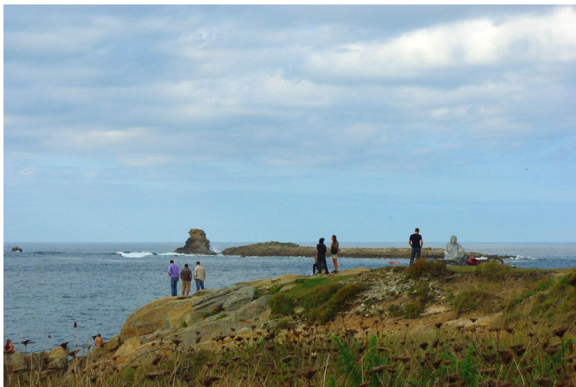
Le site du Lion, ancienne carrière, avec la statue du carrier ; au loin : le rocher du Corbeau, préservé de l'exploitation du granit